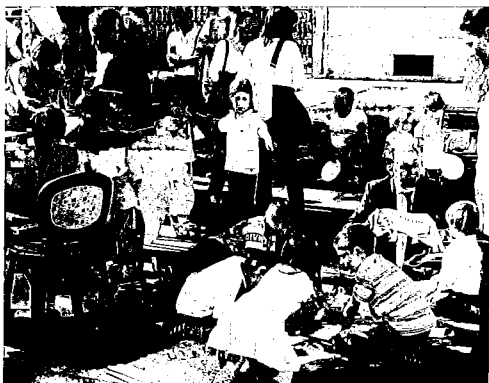
Alcune immagini di Bambini in Festa, la manifestazione che si è svolta domenica 13 maggio in alcuni Comuni della Lunigiana: tra gli altri, Mulazzo (a sinistra), Pontremoli (qui sopra), Bagnone (in alto) e Filetto di Villafranca (in alto a destra e qui a lato)

Nel mese di luglio, promossa dalla Misericordia di Villafranca